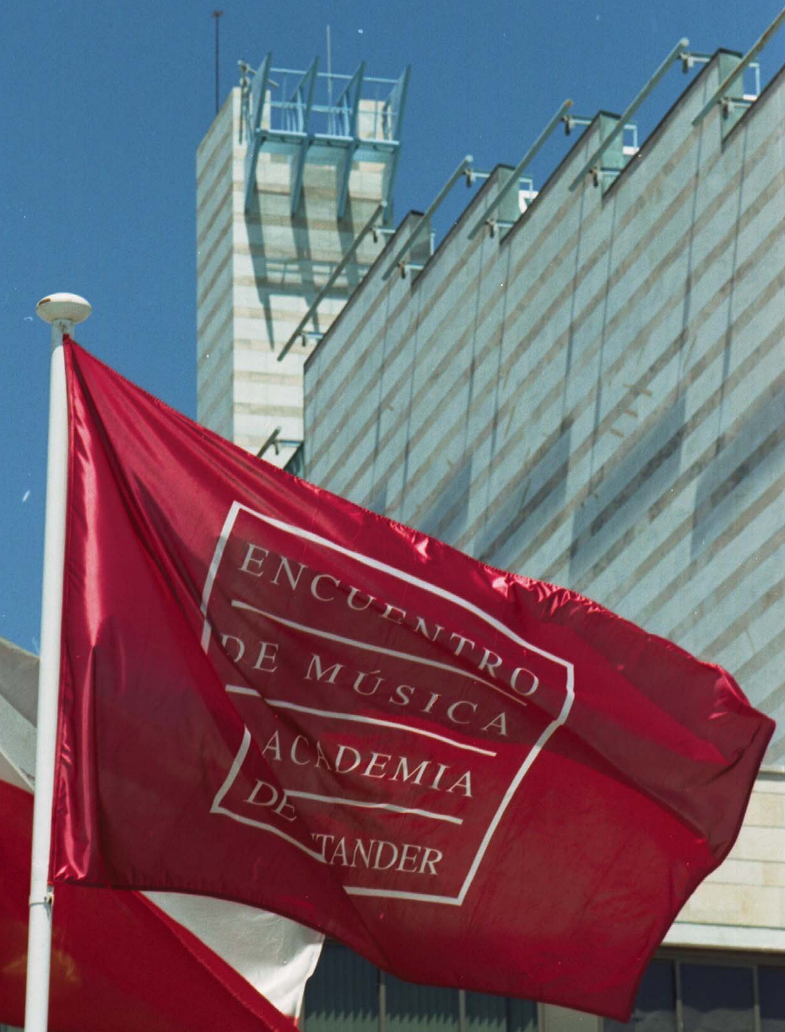
Palacio de Festivales de Cantabria