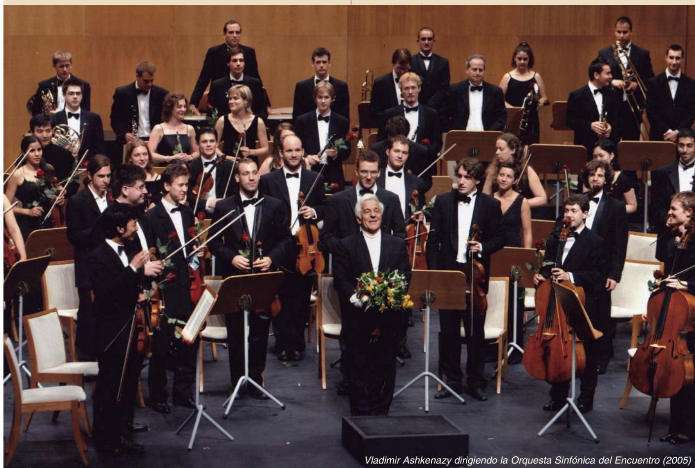
Vladimir Ashkenazy dirigiendo la Orquesta Sinfónica del Encuentro (2005)

ORQUESTA SINFÓNICA FREIXENET DEL ENCUENTRO DE MÚSICA Y ACADEMIA Vladimir Ashkenazy , director