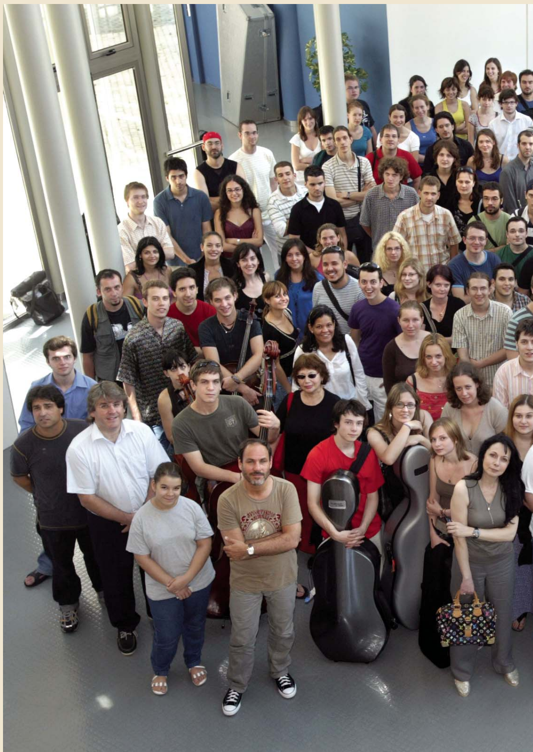
Profesores y participantes del Encuentro 2007