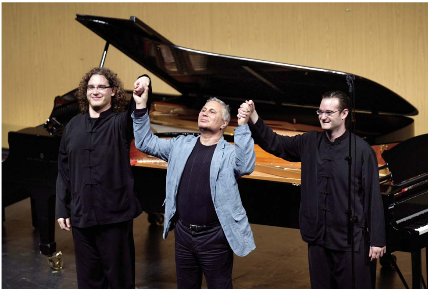
John Corigliano y el Dúo del Valle de Fundación Málaga

El Encuentro lleva años convirtiendo a Santander en un punto de encuentro para jóvenes promesas y artistas ya consagrados en el panorama internacional. En esta Octava Edición, el mundo musical seguirá acercándose a Santander pero, además, que el Encuentro de Santander sale al mundo y se presenta en la Sala Pleyel de París, una sala de historia legendaria. Allí, el público francés tendrá ocasión de conocer el trabajo del Encuentro representado por la actuación de la Orquesta Sinfónica Freixenet bajo la batuta de Vladimir Ashkenazy.