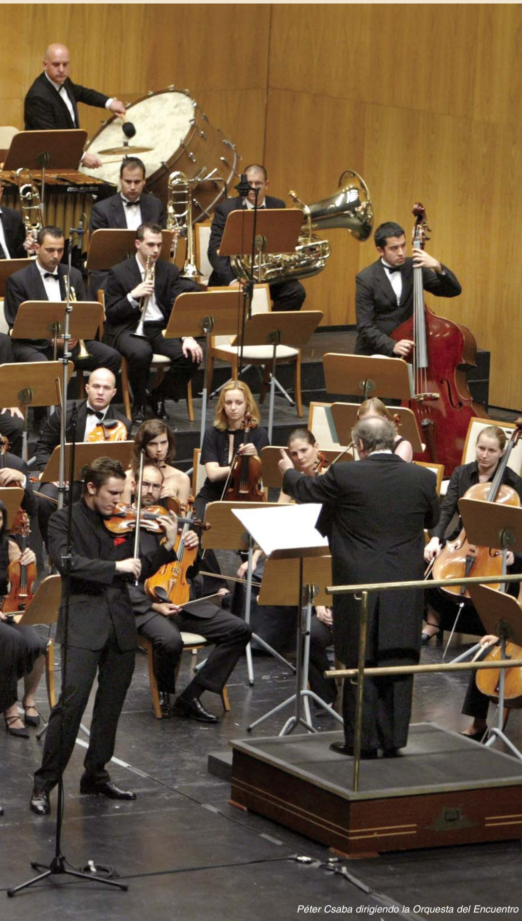
Péter Csaba dirigiendo la Orquesta del Encuentro

En el mes de julio santanderino, la música y la academia no solo se encuentran, sino que se refuerzan y se dan sentido recíprocamente. Las grandes figuras internacionales comparten la experiencia de la música con sus jóvenes colegas en un clima de cercanía y naturalidad. Esa experiencia común comienza en el aula, con las lecciones magistrales y los ensayos, pero se completa en el escenario. La organización procura disponer todo lo necesario para que ese encuentro artístico se dé en las mejores condiciones posibles delante del público cántabro, que se beneficia así de veladas de gran valor musical, muchas de las cuales resultan verdaderamente mágicas.